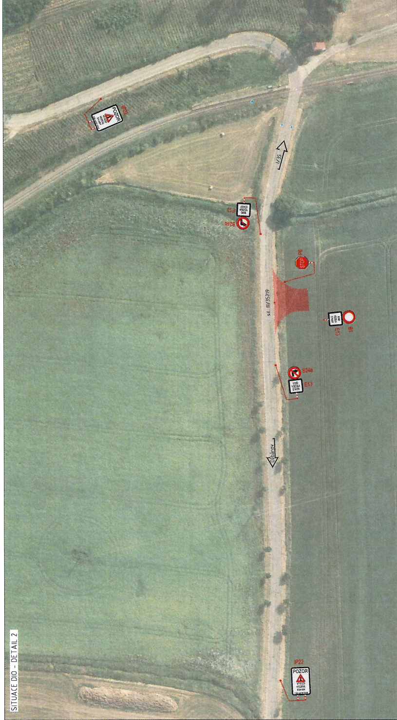
SITUACE D10 - DETAIL 2